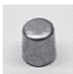
Koncovka pre výrobcu automobilov (AP)