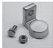
Koncovka „L“ (LT)

Uvedené elektrické hodnoty platia pre zaťaženie plne nabitej batérie a teplotu okolitého prostredia 20° C.