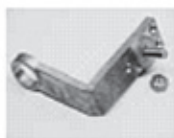
Koncovka pre autobusy (BT)