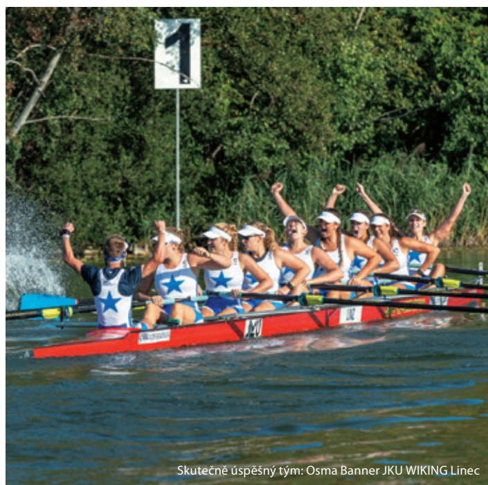
Skutečně úspěšný tým: Osma Banner JKU WIKING Linec

Veslařky na špičce německé veslařské spolkové ligy.