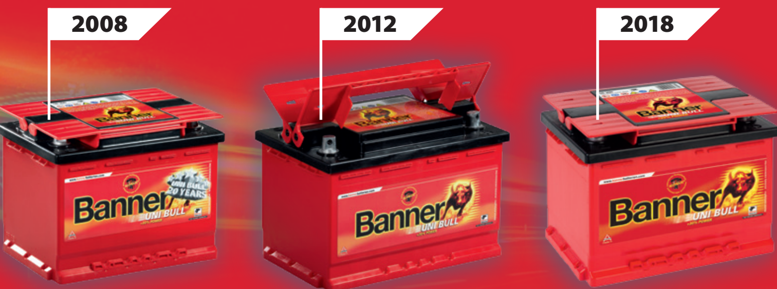
Proměna jedné legendy: Baterie Uni Bull od roku 1988 do roku 2018

Historie úspěchů od roku 1988 do roku 2018, aneb 30 let univerzálního génia. V tomto roce byla legendární automobilová baterie Uni Bull nahrazena současnými prodejně úspěšnými bateriemi Power Bull (resp. Power Bull PRO) Společnost Banner se hrdě a trochu i s lítostí ohlíží zpět za 30 lety historie úspěchů baterie Uni Bull. Přesto však: Rok 2018 znamená nejen konec legendy, ale daleko spíše nový začátek pro ještě lepší generaci baterií!