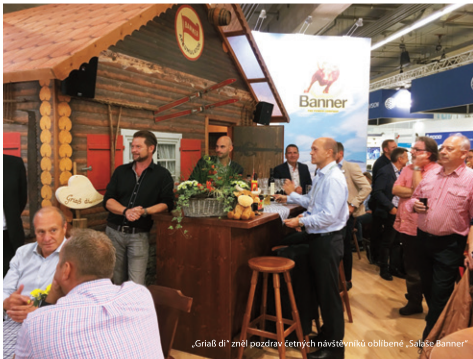
„Griaß di“ zněl pozdrav četných návštěvníků oblíbené „Salaše Banner“

Udržitelná mobilita zítřka je jasně v centru pozornosti. Společnost Banner to potvrdila na podzim na hlavním mezinárodním veletrhu automobilové branže pro oblasti vybavení, dílů, příslušenství, managementu a služeb, konaném v německém Frankfurtu nad Mohanem.