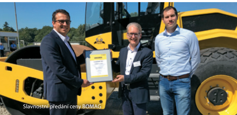
Slavnostní předání ceny BOMAG

Výrobce hutnicích strojů BOMAG ocenil společnost Banner počtvrté za sebou.